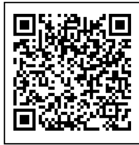
全家便利商店的購買方法由此